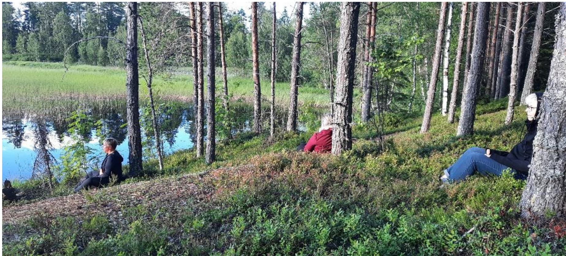
Vandring och skogsbad Bureå