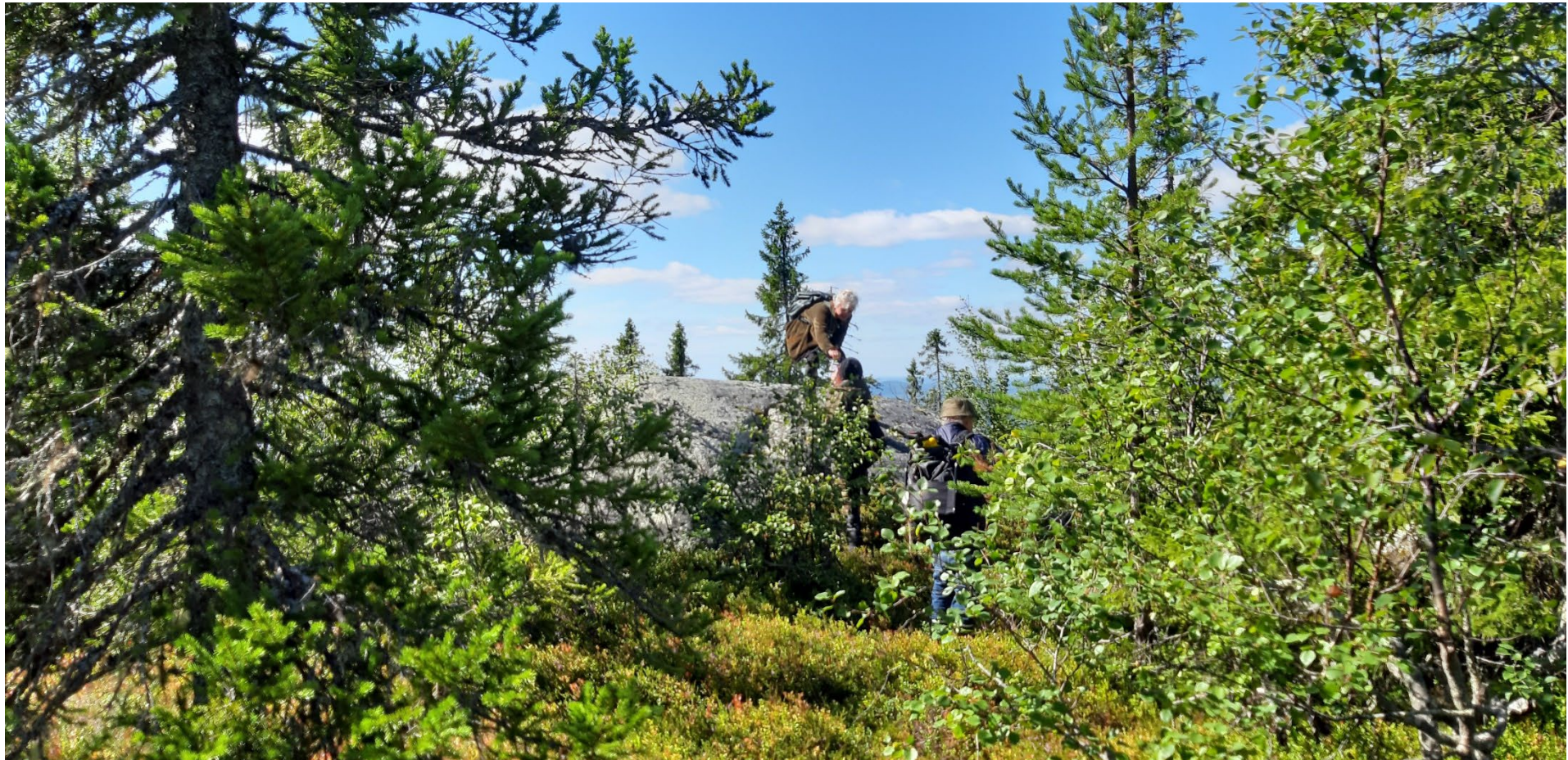
Storbergkullen, Laraborg naturreservat