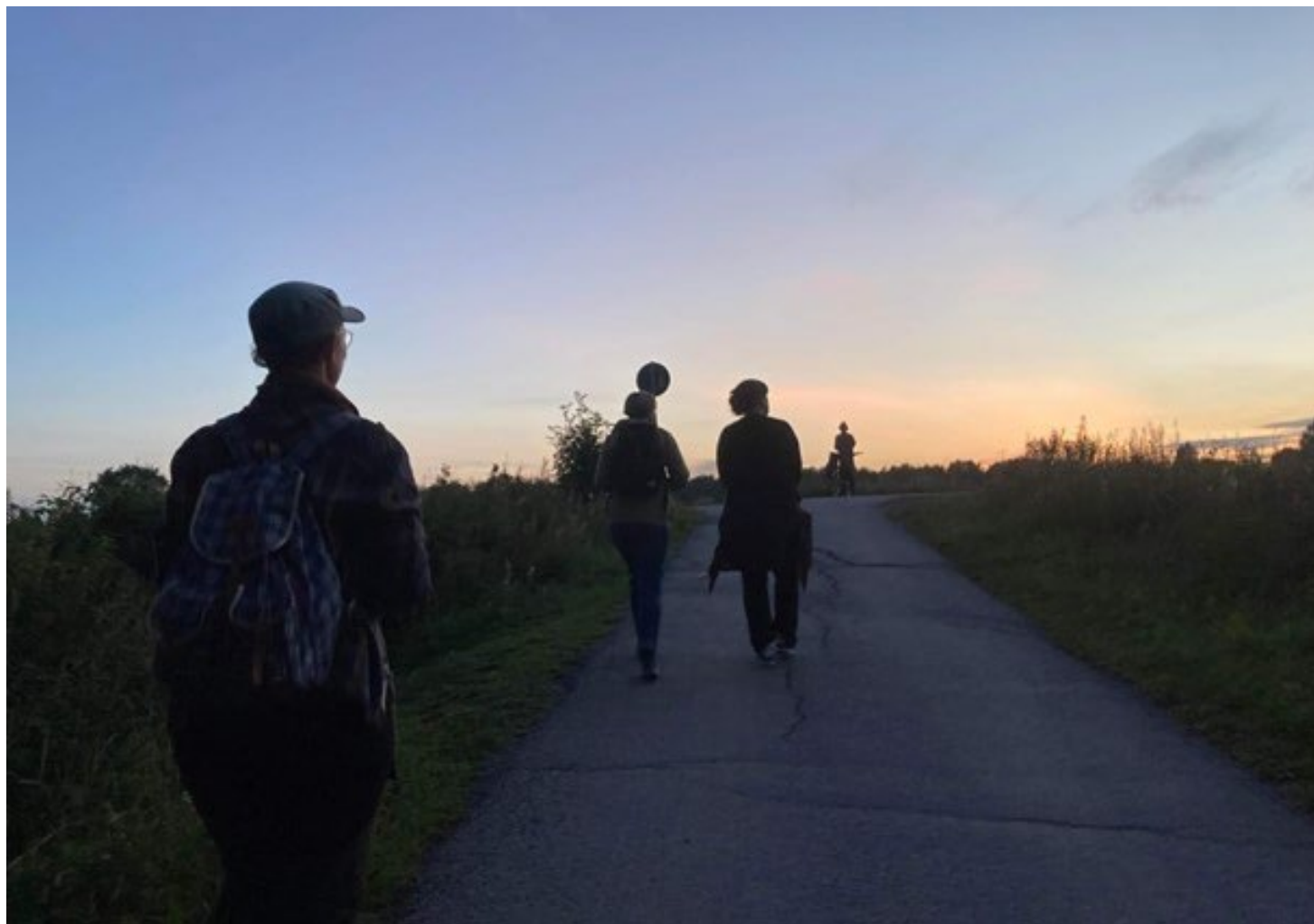
Kvällsvandring med fladdermusdetektorer längs Umeälven